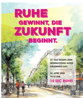
Programm für München vom 16. April bis 11. Mai

zeschutzes informierten, konnten wir zwei Forschungsgruppen der Universität München zu Cochlea Implantat Forschung und City-SoundScapes sowie die Tinnitus Selbsthilfe Liga für diesen Tag gewinnen. Das Tag-gegen-Lärm-Team des GL gestaltete für den Infomarkt eine Ausstellung zu den drei Themen „Lärmaktionsplanung der Stadt München“, „Dem Lärm auf der Spur“ und „Wohnen ohne Auto WOA“, informierte zu den Themen und konnte den GL auch mit seinen anderen Angeboten wieder ein Stückchen bekannter machen.